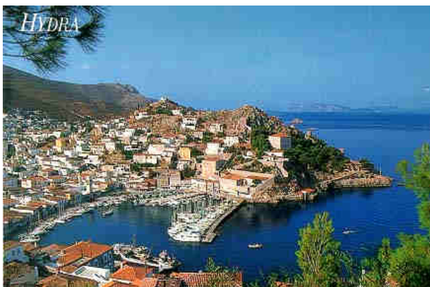
griechischer Vorzeigehafen - Hydra