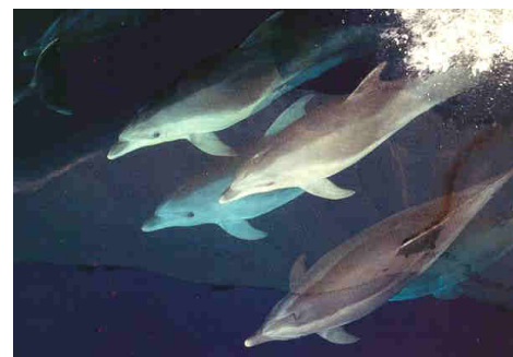
Freunde der Segler