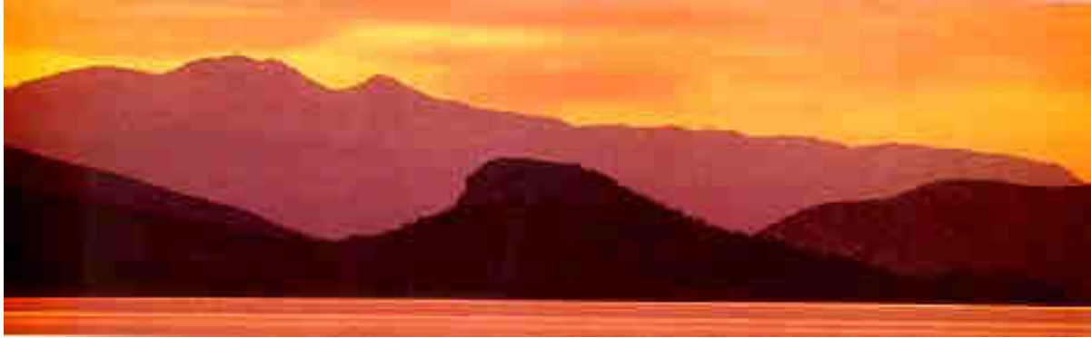
Bergkulissen bei Epidaurus