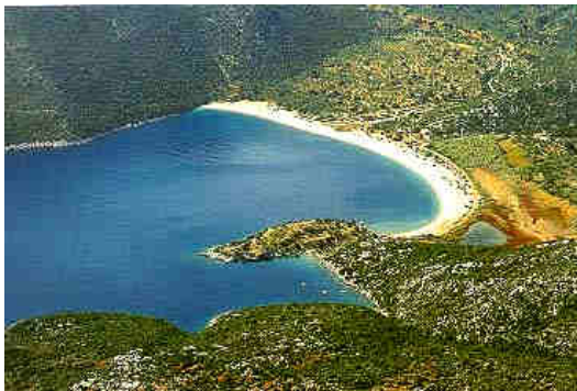
Bucht bei Kyparissi